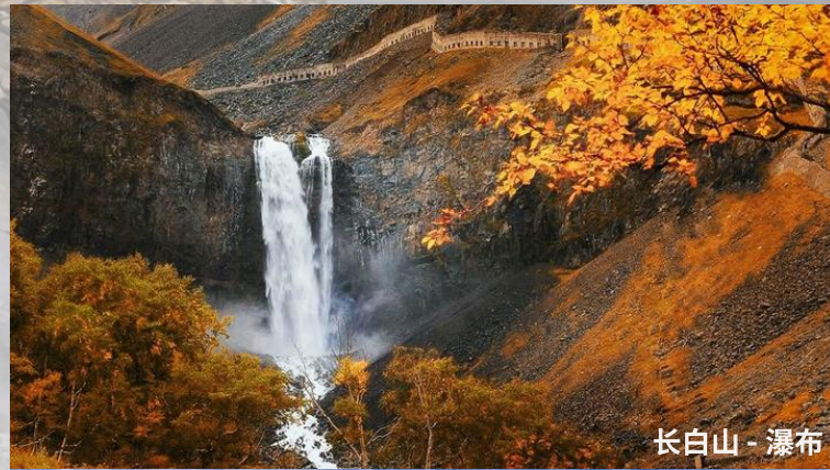
长白山 - 瀑布