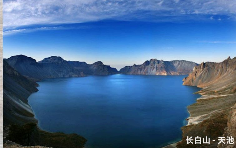
长白山 - 天池